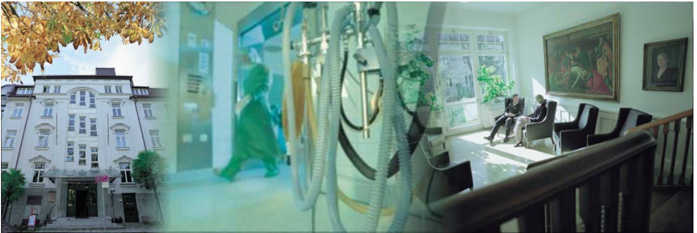
Abbildung: Verschiedene Innen- und Außenansichten der Clinic Dr. Decker

Im Herzen von München-Schwabing gelegen sind wir eine seit über 100 Jahren im Familienbesitz geführte Traditionsklinik. Wir bieten eine moderne medizinischen Ausstattung gepaart mit sozialem Engagement und persönlicher Zuwendung. Mit 55 Betten, davon 30 für die Innere Medizin und 25 Betten für die Chirurgie, tragen wir dazu bei, die Grundversorgung der Bevölkerung sicherzustellen. Privatpatienten wie auch gesetzlich versicherten Patienten bieten wir ein angenehmes Ambiente mit einem ausgesuchten Angebot an vielfältigen Serviceleistungen.